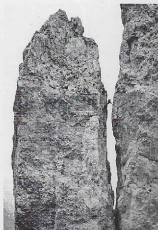
Una foto storica che ritrae il grande Emilio Comici nel momento della spaccata